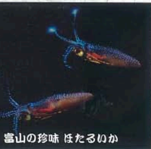
富山の珍味 ほたるいか