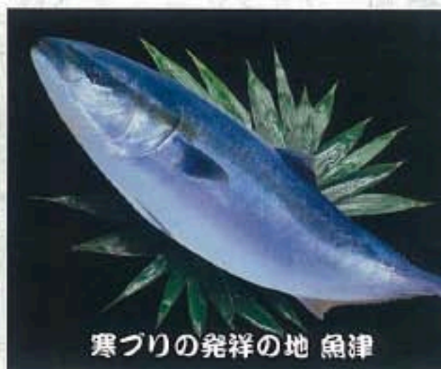
寒づりの発祥の地 魚津