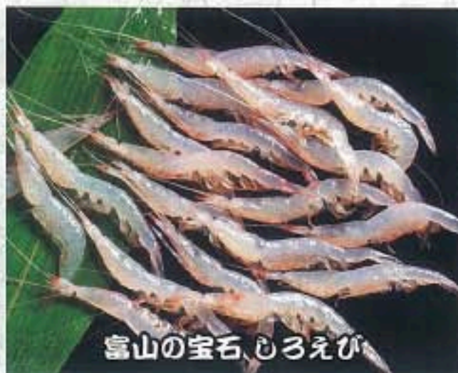
富山の宝石、しろえび